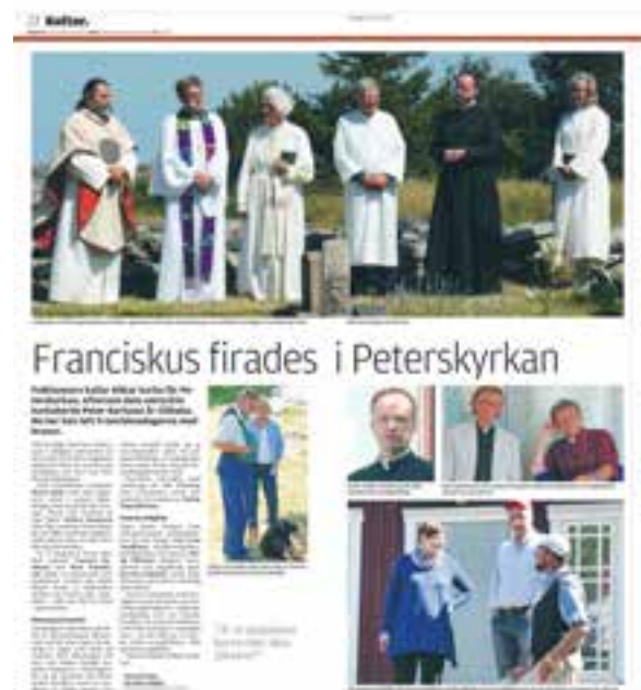
Ålandstidningen 8 juli

Årets fest finns förstuds avrapporterad på hemsidan http://franciskusfesten.com/ och så här kunde man läsa i tidningen ÅLAND den 8 juli: