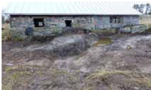
Utanför ladugårdens södra vägg, december 2014

Fas 2 tycks dröja eftersom det nya EU-programmet inte kommer i gång så snabbt, men vi har tillsammans med församlingen dränerat terrängen söder om ladugården. Det är nu, trots höstregnen, helt torrt inne i byggnaden.