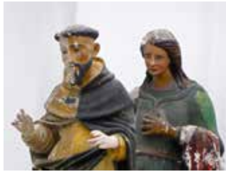
FÖRENINGEN FRANCISKUS PÅ KÖKAR 2014