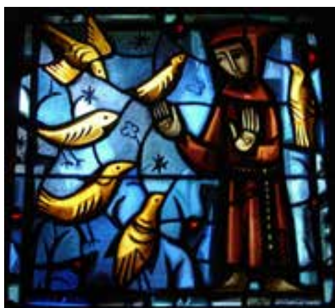
Glasfönster i Taizé