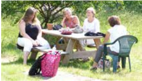
Samtal i trädgården